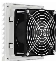
вентилятор охлаждения x 1