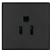
блок питания розетках 1