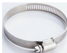
стальной крюк x 2