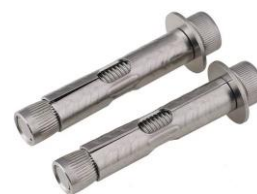
металлический винт и распорный болт x 4